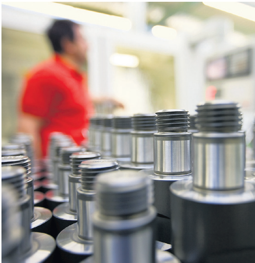
Lehrlinge gesucht - zum Beispiel in der Werkzeugherstellung.

Regional verläuft die Entwicklung der Beschäftigung von Mitarbeitern und Lehrlingen indes unterschiedlich (siehe Grafik). Am härtesten traf es die Nordwestschweiz, am besten schnitt die Zentralschweiz ab, die zudem fast 7 Prozent mehr Lehrlinge beschäftigt und damit andere Regionen weit übertrifft (siehe Grafik Lehrlinge). Über den Erwartun-